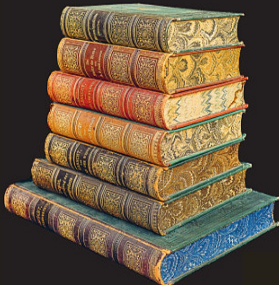
Lersch Schaukästen im Urzustand von 1880-1890